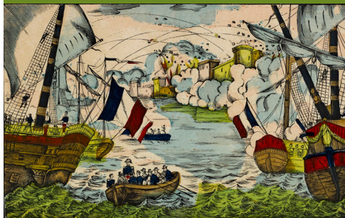
Prise du fort de Saint-Jean d'Ulloa et de la Vera-Cruz, par la marine française, 27 novembre 1838. Image d'Épinal, Imprimerie Pellerin, vers 1880, détail