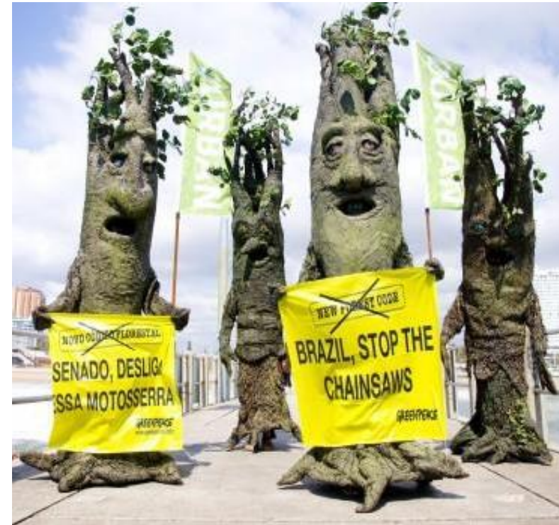
Marche des arbres pour le climat, Durban Cop 17, 2011