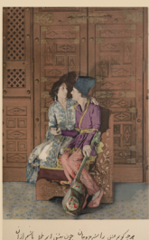
Image de couverture : Planche coloriée à l'aquarelle n° XI bis dans l'ouvrage Réminiscence d'Orient : Turquie, Perse et Syrie , de Henry-René d'Allemagne (1939), légendée d'un verset du Mathnawî de Rumi : Quoi que je puisse dire pour parler de l'Amour et pour l'expliquer, quand j'arrive à l'Amour lui-même, j'ai honte de mon explication – traduction de Eva de Vitray Meyerotitch et Djamchid Mortazavi.