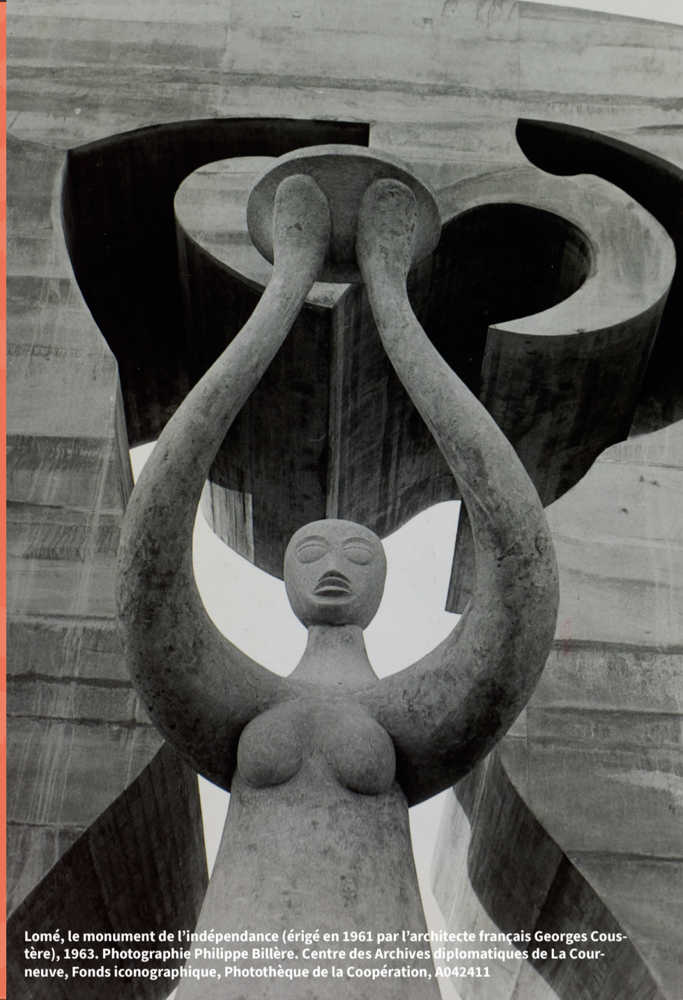
Lomé, le monument de l'indépendance (érigé en 1961 par l'architecte français Georges Cous-tère), 1963.

Les États africains nouvellement émancipés de la tutelle coloniale ont été confrontés à la nécessité de trouver leur place sur l'échiquier international. Prendre place sur les bancs de l'ONU, redéfinir les rapports avec l'ancienne métropole coloniale, établir des liens diplomatiques avec de nouveaux partenaires, ou encore s'associer (ou non) à la Communauté Européenne : les chantiers de politique extérieure constituent un enjeu central dans la construction de ces nouveaux États. Ce colloque se propose d'étudier l'émergence de ces nouvelles diplomaties à l'échelle globale, continentale et bilatérale, des années 1950 à 1990. Pour chacune de ces échelles, on mettra en évidence les modèles de souveraineté et les choix organisationnels, les acteurs des nouvelles diplomaties (dirigeants politiques, personnels diplomatiques, mais aussi réseaux informels et non-officiels), les résistances et les conflictualités. Dans le contexte de la Guerre froide, le colloque s'intéressera à l'émergence de rapports directs entre les nouveaux États africains et les superpuissances, qui peuvent s'être établis en opposition aux liens avec les anciennes puissances coloniales, mais aussi à la place des questions africaines dans les organisations internationales, et tout particulièrement dans la construction européenne.