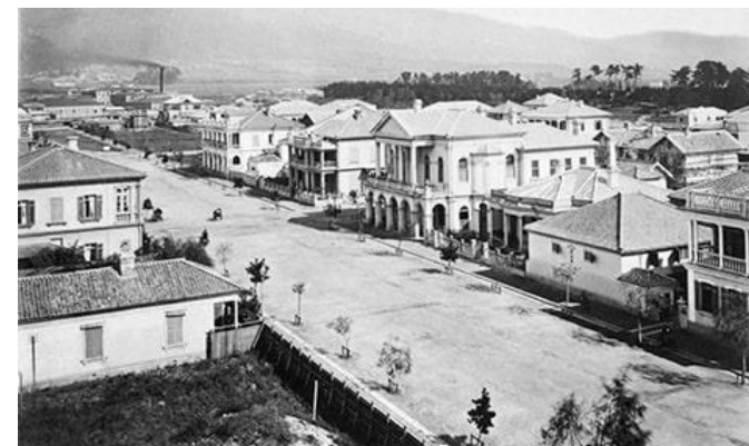
Concession de Kôbe (Kyomachisuji-Avenue) fin 19 e siècle